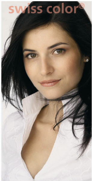
Farbkarte Mikropigmente für Permanent Make up colorcard micropigments for permanent make up

Please find more information about our products and our on-line-shop on www.swiss-color.ch